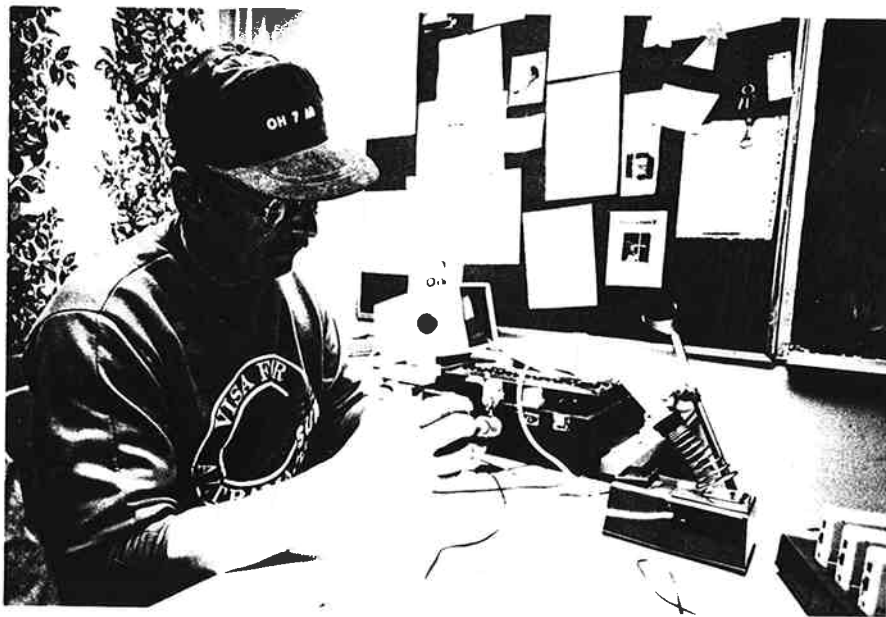
Pena, OH7MCR tarkastamassa Joensuun kuulovammaisten koulun laitteita. Kevään tempaus sai laajaa myönteistä huomiota tiedotusvälineissä.